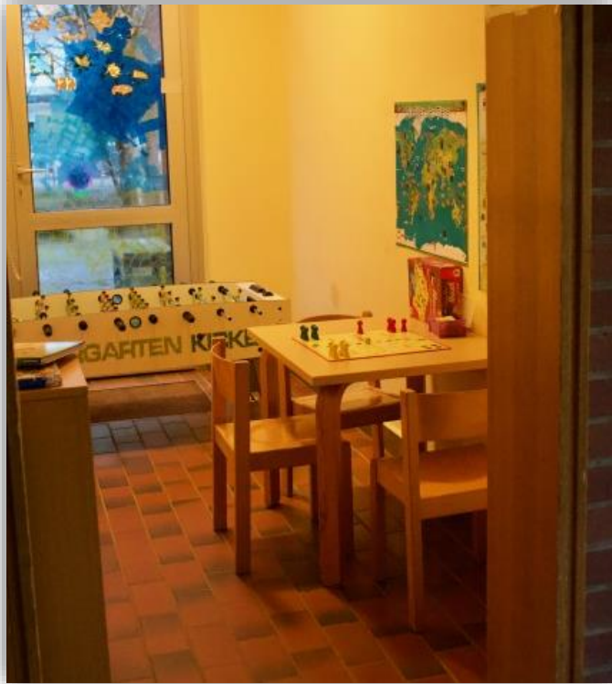
Die Wackelzahnecke (Vorschulkinder)