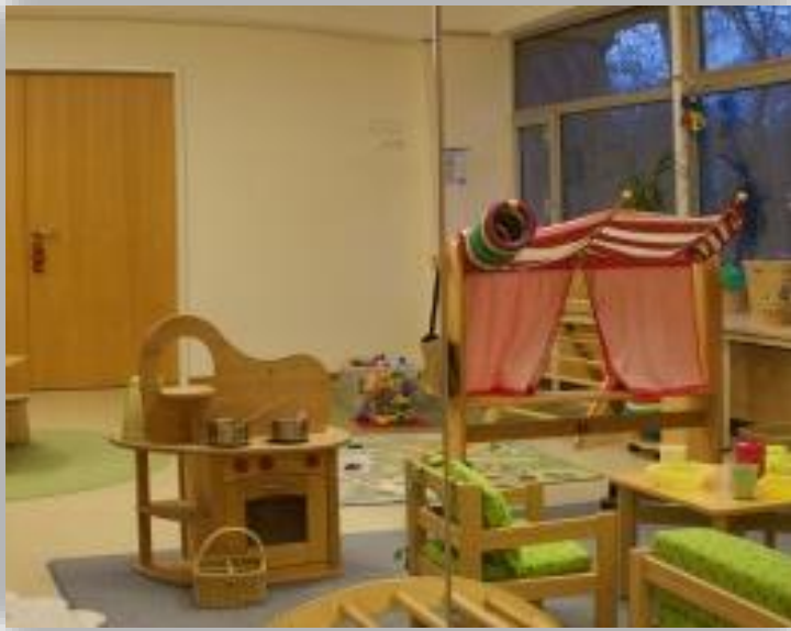
Puppentheater oder als Marktplatz.

Weiter nach hinten geht es durch den Flur zum Bewegungsraum.